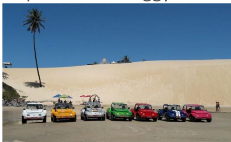
O passeio de Buggy